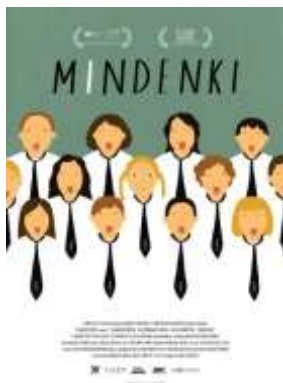
A Mindenki plakátja.

menyország c. filmben. A zárójelenet felejthetetlen: a kórus a karvezető nélkül improvizálni kezd, minden szólam, minden tag megtalálja a saját hangját egy elsöprő erejű hangorkánban. Most az Oscar-díjért szállt versenybe Deák Kristóf Mindenki c. alkotása, mely szintén egy iskolai kórusról és egy sajátos módszereket alkalmazó tanárnőről szól.