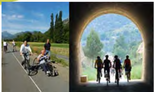
TOBY CREEK GREENWAY MASTER PLAN